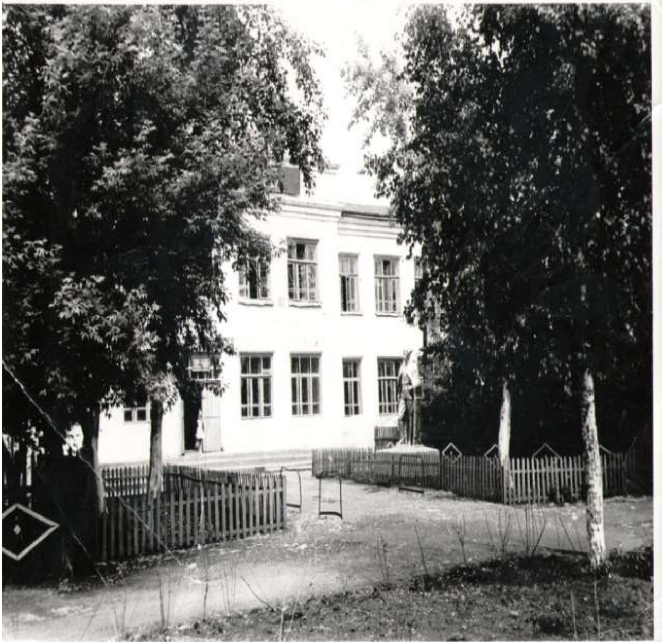
Здание Чишминской средней школы №1 в послевоенные годы.