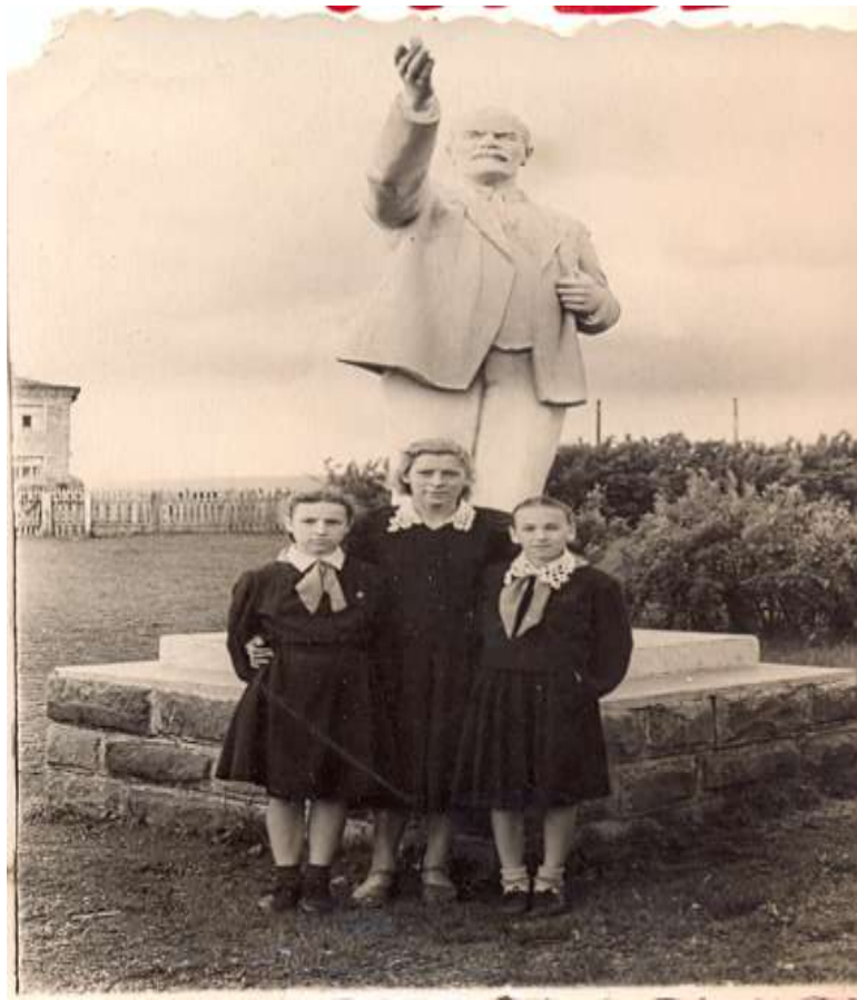
1954 год, фотография у памятника В.И.Ленину