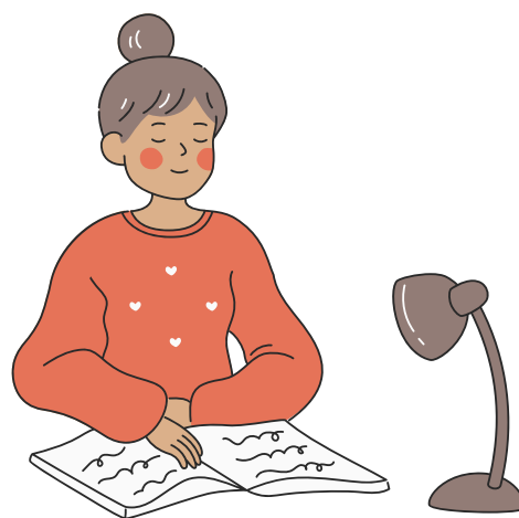
Ученица 10Б класса Казакова Виктория

Проблема, на которой основан этот проект, заключается в следующем: школьники проводят в учебном заведении большую часть своего времени: от 5 до 8 уроков в день. Многие учащиеся приезжают на занятия из других населённых пунктов до начала уроков (в соответствии с графиком подвоза), что увеличивает их пребывание в школе. В комнате отдыха учащиеся смогут реализовывать свои потребности в отдыхе, переключать своё внимание с обязательной учебной деятельности на деятельность по интересам, что повысит работоспособность на последующих уроках.