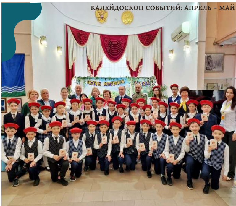
КАЛЕЙДОСКОП СОБЫТИЙ: АПРЕЛЬ – МАЙ

И СНОВА О ПРОГРАММЕ ИНИЦИАТИВНОГО БЮДЖЕТИРОВАНИЯ ШКОЛЬНИКОВ. ПРЕДСТАВЛЕНИЕ ПРОЕКТОВ